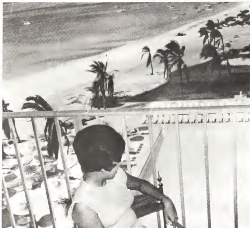
Vista for di un di e kambarnan, parti pa noord di e Hotel, riba nos playanan blanco y e laman blauw y claro di Caribe. Den fondo e botonan di e piscadornan di Noord.